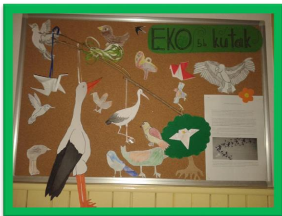
Ekopanoi u razredu