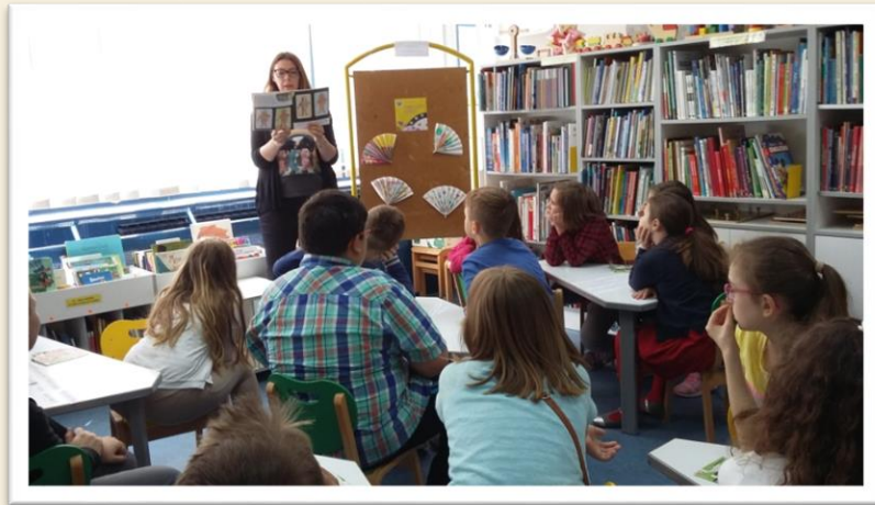
Bum, tres, trans Savica